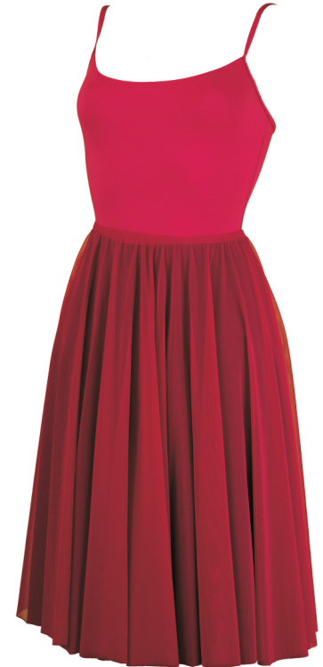
Maillot: Carla /granate Falda: Moira /granate