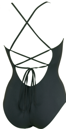
Maillot: Gillian / azul marino