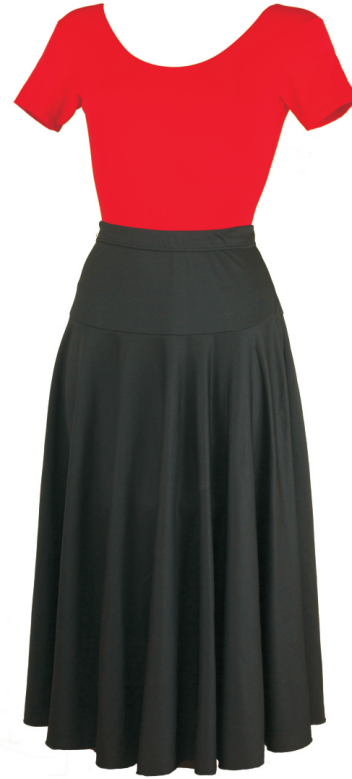
Maillot: Caila / rojo Falda: Ensayo F / negro