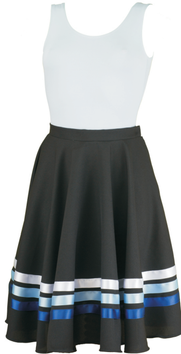
Maillot: Margot /azul Falda: Carácter /azules