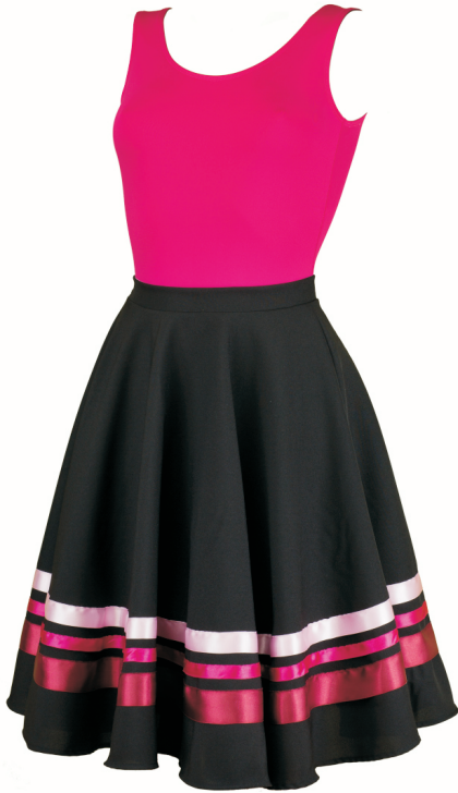
Maillot: Margot /Fucsia Falda: Carácter /rosas