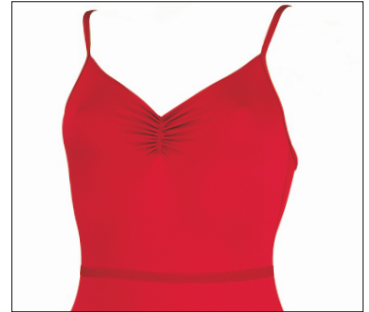
Basic B /skin