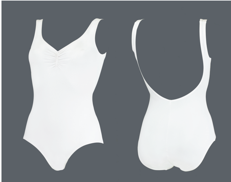
Maillot: Sylvie / blanco