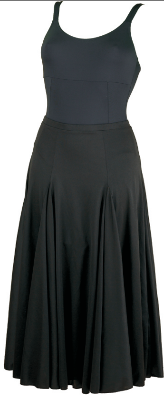
Maillot: Irina / negro Falda: Godets / negro