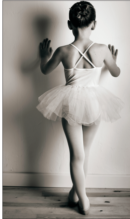
Maillot: Diana / blanco (con Tutu en cintura)