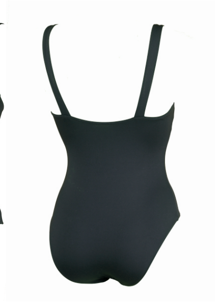
Maillot: Irina / negro